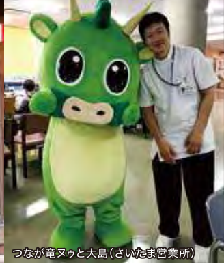
つなが電ヌッと大島(さいたま営業所)